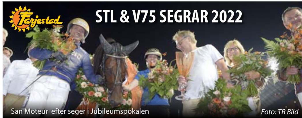
San Moteur efter seger i Jubileumspokalen