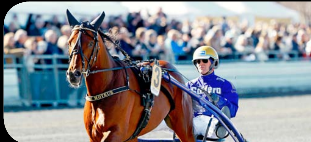
PRINS CARL PHILIPS JUBILEUMSPOKAL 2022 - San Moteur & Björn Goop